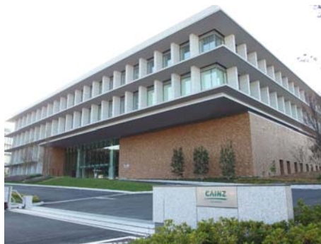
美術館のような外観を誇るカインズ様の新本部

移転作業は、旧本部が住宅地にあり休日や夜間の作業が難しいため平日業務時間内に部署単位で実施する作業計画を分単位で作成。キャビネットを書類の入ったまま独自機材で輸送するなどカインズ様の業務中断を最小限にするよう配慮しました。結果、各部署とも90分以内で移転を完了。2時間後には新本部で業務を再開していただきました。