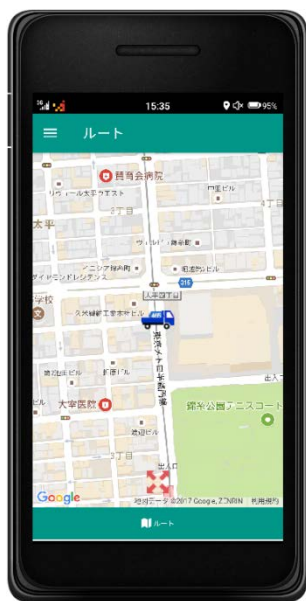
ドライバー用配送画面

本サービスに先行してスマートフォン用アプリケーション「iGOQ」の無償配布を本日より開始します。物流事業者様は、本アプリの導入と一連の登録手続きを行うことで自社車両の動態管理が無料で実現できます。