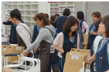
約7000台のラックへの収納作業