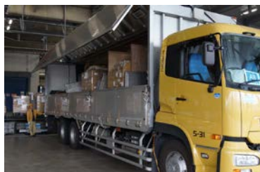
10t車延べ750台を投入して移送

移転作業は、4月27日から5月4日までの間に大型トラック延べ750台、作業員延べ400名で取り組み、実質4日間で完了。搬出・搬入のピークとなった5月3日には、フォークリフト50台、フォークマン70名を投入して大量の商品在庫を移動させました。